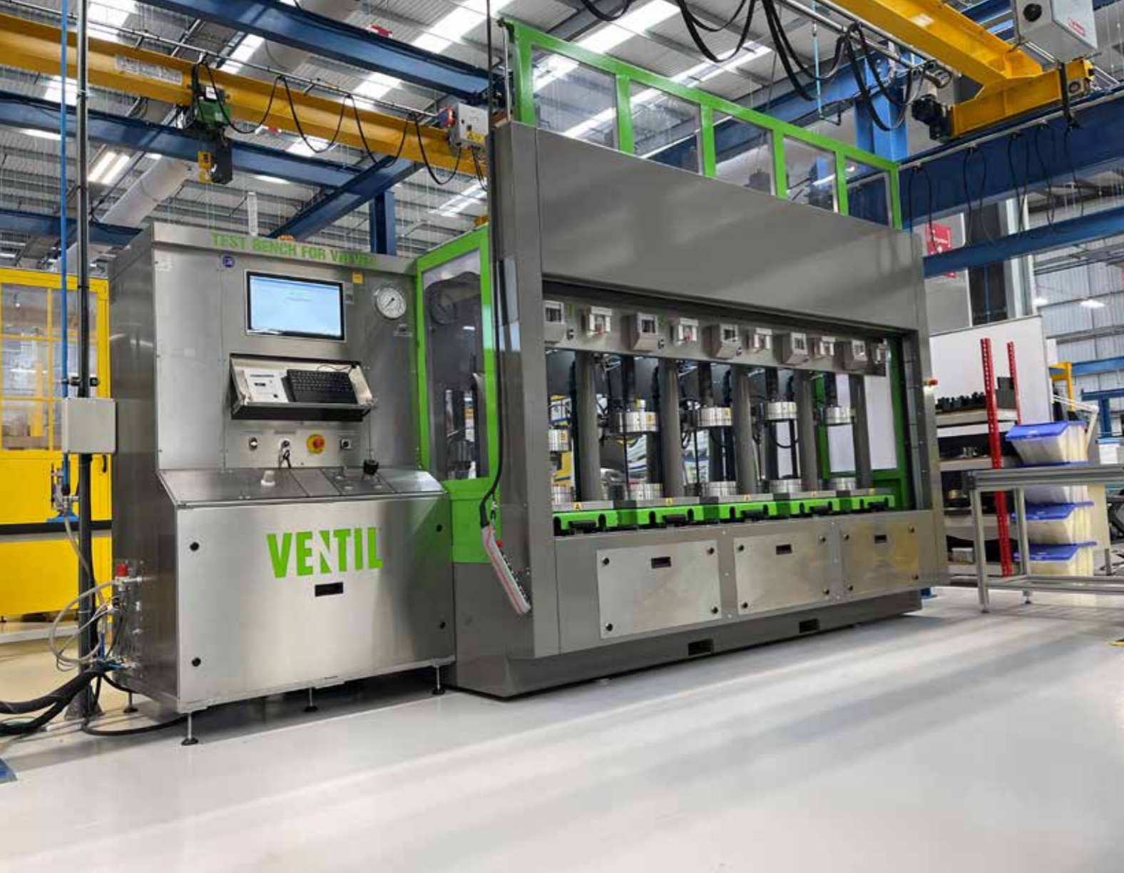
De voorzijde van een testinstallatie voor afsluiters, waarin het coax-ventiel is toegepast.

Of Ventil wel of niet een coax-ventiel toepast bij haar testsystemen, dat hangt af van het type klant en de eisen met betrekking tot de automatiseringsgraad, zo legt Lechevallier uit. "Bij klanten die geen automatisering toepassen bieden coax-ventielen geen meerwaarde. Moet een drukteststelsel wel geautomatiseerd worden voor een klant om testen over een groter drukbereik, van 0 tot 500 of zelfs tot 1.000 bar te kunnen uitvoeren, dan biedt het coax-ventiel uitkomst. Dit heeft de maken met de lektheid van de ventielen. Als Ventil bouwen wij bovengenoemde ventielen altijd op dezelfde wijze in bij onze druktestsystemen, zodat te allen tijde wordt gewerkt met een beproefd systeem. Zeker als het binnen bepaalde drukklassen blijft. De toegepaste coax-ventielen komen bij onze druktestsystemen nooit boven de 12 mm interne diameter uit." Interessant te melden is dat Ventil coax-ventielen altijd andersom gebruikt. Normaliter stroomt iets door een leiding en staat de pijl in de stromingsrichting, maar bij Ventil stroomt het medium in tegengestelde richting om het vervolgens te kunnen insluiten. Omdat al onze druktestsystemen op dezelfde wijze kunnen worden gebouwd, kan per project dus worden volstaan met het selecteren van de juiste