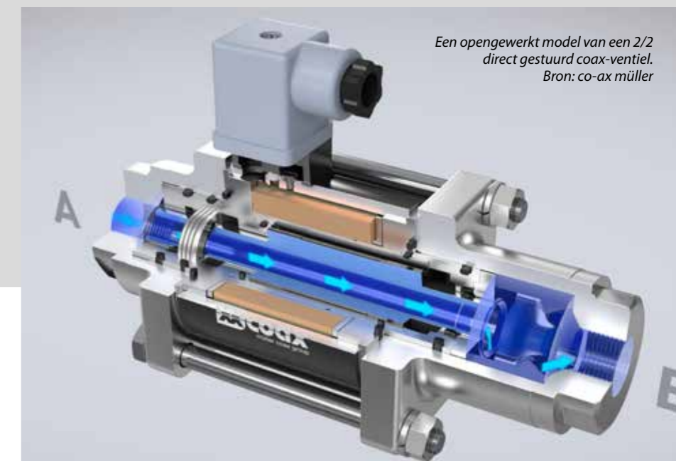
Een opengewerkt model van een 2/2 direct gestuurd coax-ventiel.

"De 2/2 of 3/2 direct of indirect gestuurde coax-ventielen zijn, zeker met de komst van het nieuwste model de KX 1000, inzetbaar in diverse applicaties zoals bij tankstations, gasturbines, testbanken, elektrolyseprocessen en waterstofapplicaties. Denk bij waterstofapplicaties aan waterstof-opslagsystemen en de winning van waterstof. De ventielen zijn geschikt voor alle mediums met een hoge viscositeit, behalve zuren. Kenmerkend voor deze ventielen zijn de zeer hoge werkdrukken, de grote doorstroming, de snelle schakeltijden en de lange levensduur. Zo kan de doorstroming, afhankelijk van het model, variëren van 0,066 tot 650 m 3 /u. In vergelijking met conventionele ventielen is de levensduur van deze ventielen zeker 10 maal langer. De nagenoeg onderhoudsvrije ventielen zijn compact qua bouwvorm, hebben een minimale hoeveelheid bewegende delen en de spoel is ingebouwd.